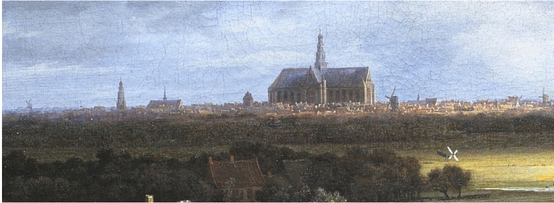
Figuur 1 – Uitsnede uit het Gezicht op Haarlem (vanuit het westen) door Jacob van Ruisdaal, circa 1670. Links van de Grote of Sint-Bavokerk is het langwerpige dak met in het midden het torentje van de Janskerk te zien. Deze kerk werd sinds 1587 gebruikt voor de protestantse eredienst – Mauritshuis, Den Haag .