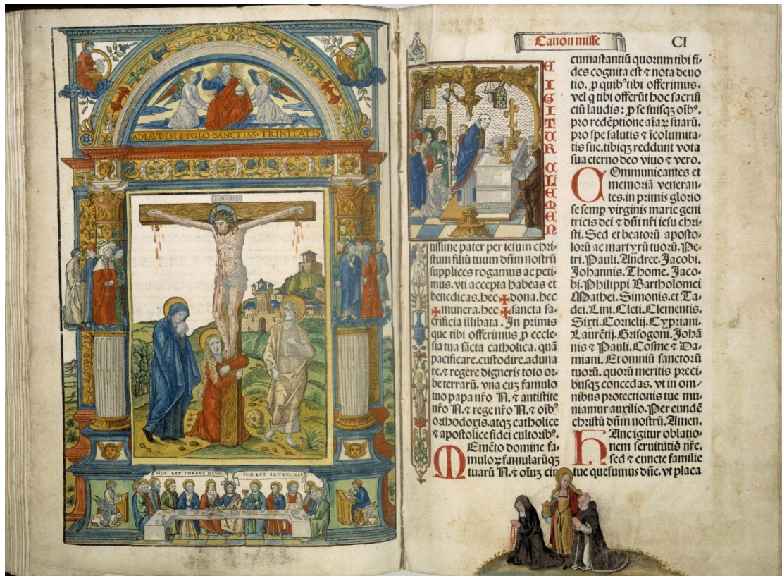
Figuur 4 – Een missaal van 1504 uit het Dominicanenklooster. Dit boek, dat gebruikt werd bij de misvieringen, kwam niet in het bezit van de stad. In 1873 bevond het zich in de kerk van de Dominicusparochie in Haarlem. Daarna is het via het Bisschoppelijk Museum Haarlem in Museum Catharijneconvent gekomen – Museum Catharijneconvent, Utrecht.