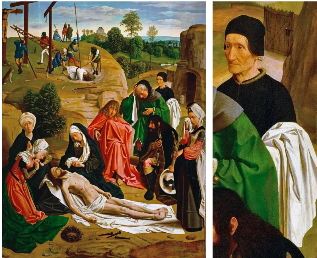
Figuur 3a en b – De Bewening van Christus uit het Jans klooster. Via dit schilderij wordt de dood van Jezus Christus herdacht, maar door de man in het zwart achter in de groep, met de witte lijkwade over de arm, diende de voorstelling waarschijnlijk ook om de oorsprong van de Jansorde te gedenken, Geertgen tot Sint Jans, circa 1485 – Kunsthistorisches Museum, Wenen.

De man kan als een voorloper van de ordebroeders zijn beschouwd. Volgens een legende zou het gasthuis in Jeruzalem waaruit de Jansorde voortkwam al hebben bestaan toen Johannes de Doper en Christus nog leefden. In een kopie van het schilderij ontbreekt de man, zie figuur 5 hieronder. Dit kan betekenen dat hij alleen belangrijk was voor de Jansheren en dat anderen niet in het verhaal geloofden. Zie verder de website Janskerk Haarlem 700 jaar , onder Gedenken in de praktijk: Gebeurtenissen , en daarin speciaal Verwerving van relieken.