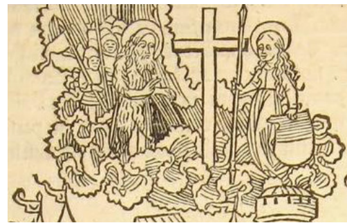
Figuur 2a en b – In 1480 werd het eiland Rhodos ontzet dat door de Turken belegerd was. Dit gebeurde met behulp van Maria en Johannes de Doper die in de prent boven het eiland zijn afgebeeld. Rhodos was toen het hoofdkwartier van de Jansorde. Het gaat in deze afbeelding dus om het vieren van een overwinning en het herdenken van de steun van heiligen. Afbeelding in Guillaume Caoursin's Obsidionis Rhodie Urbis Descriptio (Beschrijving van het beleg van de stad Rhodos) uit 1496, fol. 12v .