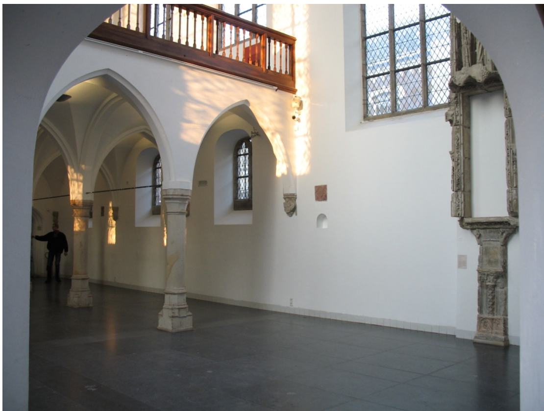
Figuur 5 – Kapel met de 'nonnengalerij' van het vroegere Agnieten- of Agnesconvent in Utrecht waarin nu het Centraal museum gevestigd is. Vanaf deze 'bovenverdieping' konden de zusters, zonder in contact te komen met de gelovigen beneden in de kapel, de eredienst bijwonen – Centraal Museum, Utrecht.

Er is lang voorondersteld dat deze veranderingen, van informele gemeenschap naar een klooster met clausuur en/of een strengere regel, vanzelfsprekende ontwikkelingen waren, ontwikkelingen dus naar het 'echte' kloosterleven. Onderzoekers plaatsen hier inmiddels vraagtekens bij. Zij constateerden dat individuele zusters zich verzetten tegen de clausuur, dat een aantal van hen zelfs het klooster verliet en, last but not least , dat het grootste aantal kloosters van het Kapittel van Utrecht niet overging tot de clausuur en/of een strengere regel. Voor het grootste deel van de kloosters was er dus helemaal geen sprake van een vanzelfsprekende ontwikkeling.