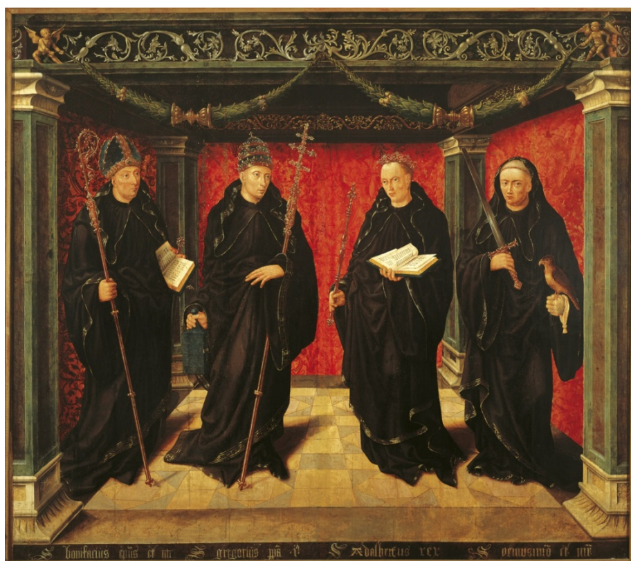
Figuur 6 – Vier heiligen van de orde van de Benedictijnen (detail). Dit schilderij uit het eerste kwart van de zestiende eeuw is afkomstig uit de abdij van Egmond. Het toont vier belangrijke heiligen van de orde in het zwarte habijt. Van links naar rechts zijn het: Bonifatius, paus Gregorius de Grote, Adelbertus en Jeroen van Noordwijk

Men wilde graag tonen bij welke groep men hoorde, en hoe de eigen opvattingen eventueel afweken van die van andere kloosterorden. Dat kon bijvoorbeeld door de patroonheilige van de eigen orde te laten afbeelden in de altaarstukken in de kloosterkerken. Onder andere in Italië zien we nog steeds kerken van Franciscanerkloosters volledig beschilderd met voorstellingen uit het leven van Franciscus, zie bijvoorbeeld de basiliek van Sint-Franciscus in Assisi .