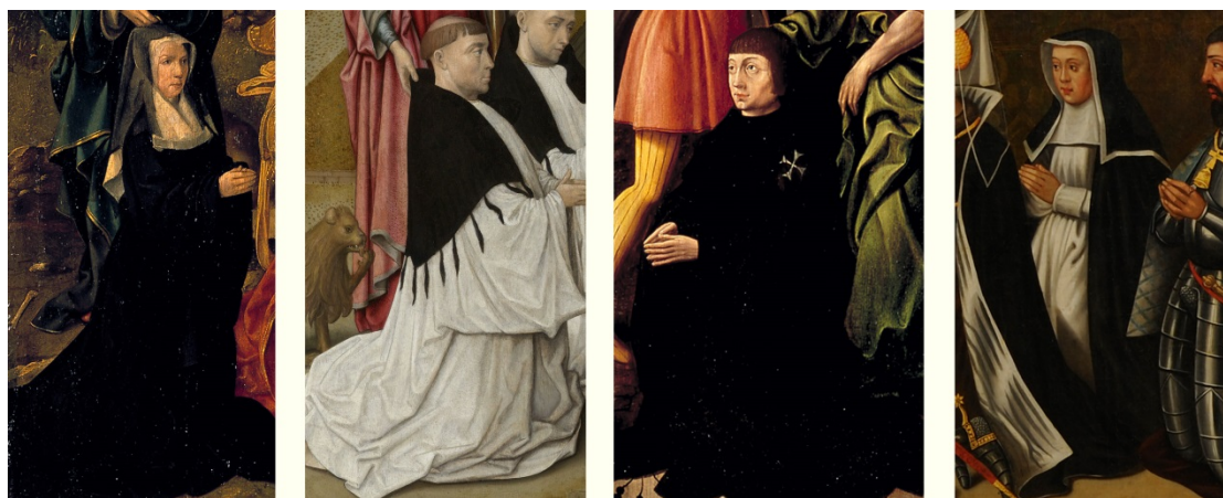
Figuur 1 – Van links naar rechts een Benedictines uit het klooster Oudwijk bij Utrecht; een Reguliere kanunnik, mogelijk uit het Regulierenklooster bij Haarlem; een Jansheer uit het Jansklooster in Haarlem, en een Reguliere kanunnikes uit het klooster Mariënpool bij Leiden, in de kleding van de desbetreffende orden van de zestiende eeuw – details van schilderijen (zestiende eeuw) respectievelijk uit Museum Catharijneconvent Utrecht, Rijksmuseum Amsterdam, Museum Catharijneconvent Utrecht, en Museum De Lakenhal Leiden.

De teksten kunnen ieder afzonderlijk worden gelezen. Wie ze achter elkaar wil door nemen, zal dan ook enkele herhalingen aantreffen.