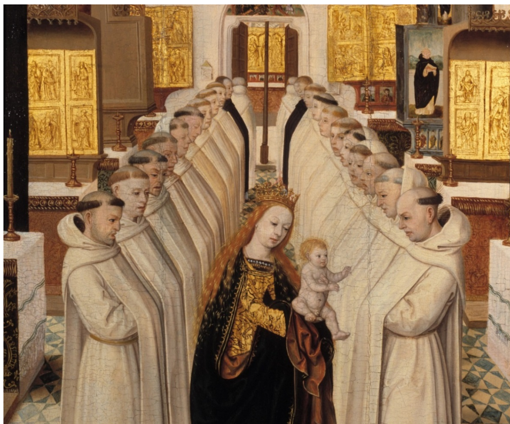
Figuur 3 – Detail van een schilderij met Maria en Jezus die verschijnen aan Dominicus. De broeders staan in een dubbele rij, als in een processie in de kerk, circa 1500 – Museum Catharijneconvent, Utrecht .

De kleding toonde tot welke orde en vaak ook tot welke rang men behoorde. In mannenkloosters gold dat vaak ook voor de haardracht. Wie in de stad een mannelijke kloosterling tegenkwam, wist dus onmiddellijk met wie men te maken had.