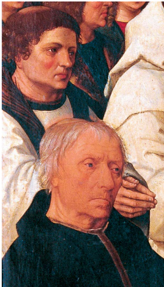
Figuur 8 – Geboorte van Jezus met de familie Boelen, Jacob Cornelisz. van Oostsanen, 1512 – Museo Nazionale di Capodimonte, Napels. Totaalopname en detailopname met twee geestelijken (nr. 2 en 3, wereldheren, geen kloosterlingen) uit het gezin Boelen. Beiden hebben een kleine kruinschering (vergelijk dit met de kruinschering van de Kartuizer kloosterling, nr. 4).