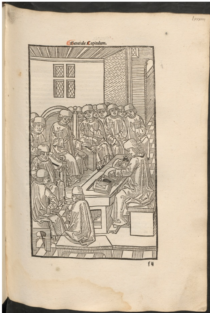
Figuur 2 – Het generaal kapittel van de Jansorde is bijeen. De schrijver noteert alle besluiten. Afschriften daarvan werden door de deelnemers meegenomen naar hun eigen gebied en daar verspreid over de vestigingen van de orde. Prent uit Gauillaume de Caoursin, Obsidionis Rhodie Urbis Descriptio (1496), geen foliëring – Universiteitsbibliotheek Utrecht.