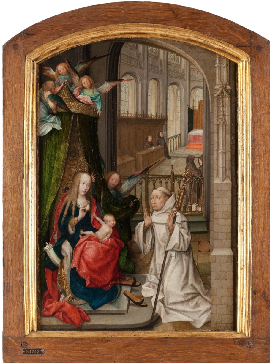
Figuur 7 – Maria met Kind en Bernardus van Clairvaux. Bernardus van Clairvaux, misschien wel de belangrijkste heilige van de Cisterciënzers is in dit schilderij afgebeeld in het witte gewaad van deze orde, circa 1500 – Museum Catharijneconvent, Utrecht.

De kleding was ook een manier om de eigen identiteit te tonen en dus te laten zien bij welke groep en orde men (wel en niet) behoorde en de saamhorigheid te versterken. 29