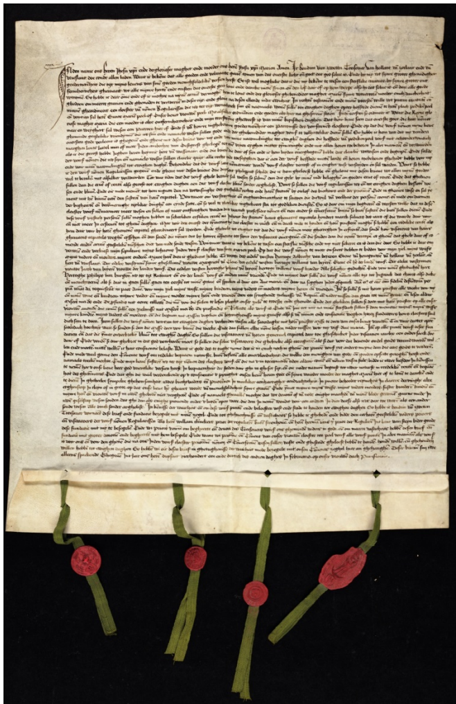
Figuur 9 – Stichtingsakte uit 1431 van het klooster Mariënpoel bij Leiden.

De stichting van het klooster Mariënpoel is wat dit betreft een duidelijk geval. Het werd gesticht door Boudewijn van Zwieten, een hoge functionaris van Filips de Goede, graaf van Holland (van 1419-1467). Het klooster ontstond in 1428 toen de zusters van een klooster in Oudewater, vanwege verschillende politieke conflicten die tegelijkertijd speelden, daar moesten vertrekken. Boudewijn van Zwieten stichtte daarom voor deze zusters een klooster vlakbij Leiden. Hij had met deze maatregel vast en zeker behalve religieuze ook politieke bedoelingen. Als functionaris van de graaf van Holland hing hij kennelijk diens standpunten aan, en met de stichting van het klooster dat moest vluchten voor de tegenpartij liet hij dat ook nog eens duidelijk zien. Zie over deze kwestie de website Prayer and Politics .