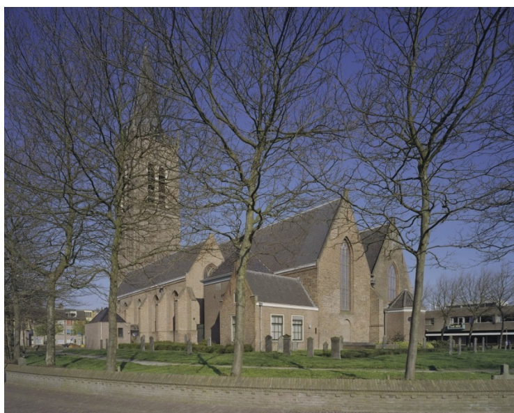
Figuur 4 – De vroegere Agathakerk, nu de Grote Kerk in Beverwijk. Deze laatgotische kerk werd in 1575 in gebruik genomen voor de gereformeerde eredienst, maar werd een jaar later door de Spanjaarden verwoest. Delen van muren, een aantal pilaren en de toren bleven bewaard, foto uit 2005 – Rijksdienst voor het Cultureel Erfgoed, Wikimedia Commons .