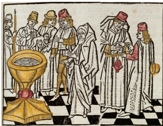
Figuur 10 – De doop . Van links naar rechts zien we zes personen: een assistent van de priester met een kaars, de priester met het kindje, een man van wie de rol niet duidelijk is, en de ouders van het kind. Rechts van deze groep staan de leermeester en zijn leerling.