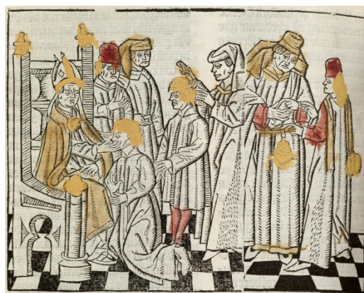
Figuur 13 – Het vormsel wordt toegediend door de bisschop. Hij zit op zijn zetel terwijl één voor één de vormelingen voor hem neerknielen. Hij zegent ze door een kruisteken te maken op hun voorhoofd.

3. De communie : wie gebiecht had, mocht de communie ontvangen. De communie is, samen met de consecratie (figuur 12), het belangrijkste onderdeel van de heilige mis. Tijdens de mis werd het lijden van Christus steeds opnieuw herdacht, elke dag, in elke kerk, in elk klooster, meestal zelfs meerdere malen.