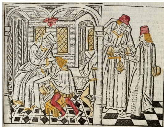
Figuur 11 – De biecht . Hier zien we een biechteling die de zegen krijgt van de priester. Zijn zonden zijn hem vergeven. Achter hem staat de volgende al klaar om zijn zonden op te biechten. De leermeester legt uit wat 'penitentie' (spijt, berouw hebben) betekent. Wie geen berouw had over het begane kwaad, kon biechten zoveel hij of zij wilde, God zou de zonden nooit vergeven.