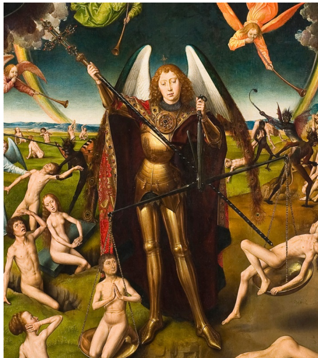
Figuur 16 – Detail van Het Laatste Oordeel. De heilige Michaël weegt de zielen en duwt met zijn lans de ziel die te licht is bevonden uit de weegschaal. De ziel in de andere schaal heeft de handen in gebed gevouwen.

De [4] andere zielen worden door engelen naar de poort van de hemel geleid. Ze worden er opgewacht door Petrus en door engelen die hen nieuwe kleding geven. [5] Hoog boven in de poort maken engelen hemelse muziek.