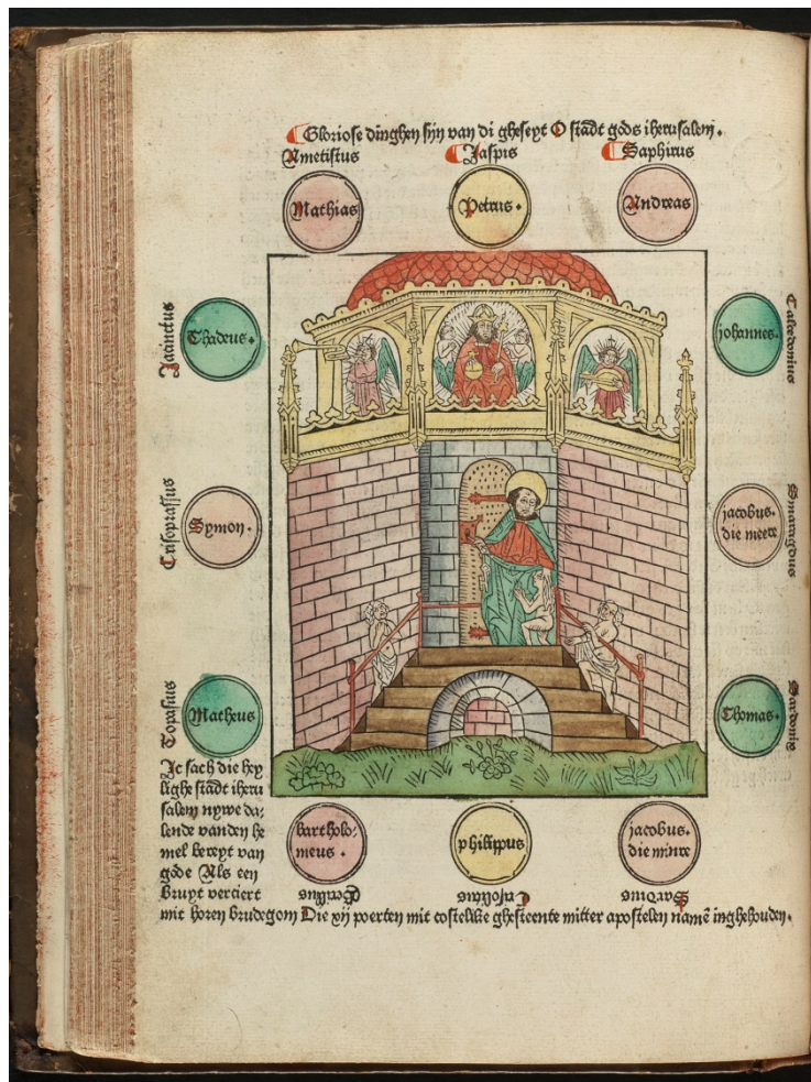
Figuur 8 – Petrus laat zielen toe tot de hemel, prent in een Nederlandse vertaling uit 1480 van een wereldkroniek (geschiedenis van de wereld), de Fasciculus temporum , van Werner Rolevinck. De kroniek bevat de geschiedenis vanaf de schepping tot het jaar 1474, het jaar waarin de eerste druk verscheen in Keulen – Noord-Hollands Archief, Haarlem.

Petrus wordt daarom in voorstellingen soms afgebeeld als paus, maar in deze prent (figuur 8) zien we hem als bewaker van de hemelpoort. 18 In de hemel wacht Christus als heerser over hemel en aarde. Engelen musiceren aan zijn zijden. Drie zielen klimmen de trap op en Petrus doet voor hen de deur open.