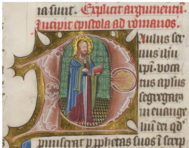
Figuur 6 – Versierd initiaal in de eerste bladzijde van de brief van Paulus aan de Romeinen uit een driedelige Bijbel van het Jansklooster (deel 3), tussen 1450 en 1470. Boven de initiaal staat in rode letters 'Incipit epistola ad romanos' (Begin van de brief aan de Romeinen) – Noord-Hollands Archief, Haarlem.

Behalve Johannes zouden alle apostelen vermoord worden. Zij behoren tot de eerste groepen martelaren die vanwege hun geloof werden omgebracht en die daarom binnen het christendom als heiligen worden vereerd en herdacht.