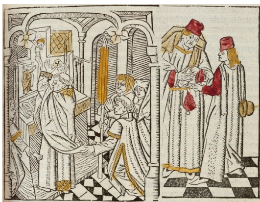
Figuur 12 – In deze prent is het moment van de consecratie afgebeeld. De priester staat voor het altaar waaraan hij de mis opdraagt en heft het brood omhoog, naar God. Hij wordt bijgestaan door twee assistenten. Ook knielen er twee gelovigen, een man en een vrouw.