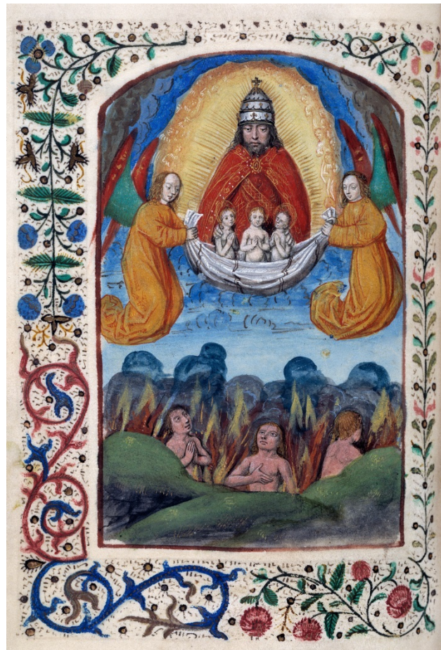
Figuur 17 – Miniatuur met de verlossing van zielen uit het vagevuur uit een Nederlands getijden- en gebedenboek, circa 1490-1495, oorspronkelijke verblijfplaats onbekend – Museum Catharijneconvent, Utrecht.

Uiteindelijk werden de opvattingen over het vagevuur opgenomen in de geloofsleer van de Kerk, dus in de waarheden waarin iedere christen geloofde en moest geloven. In 1336 legde paus Benedictus XII (pauze van 1334 tot 1342) vast wie wel en wie niet een reiniging in het vuur moesten doorma-