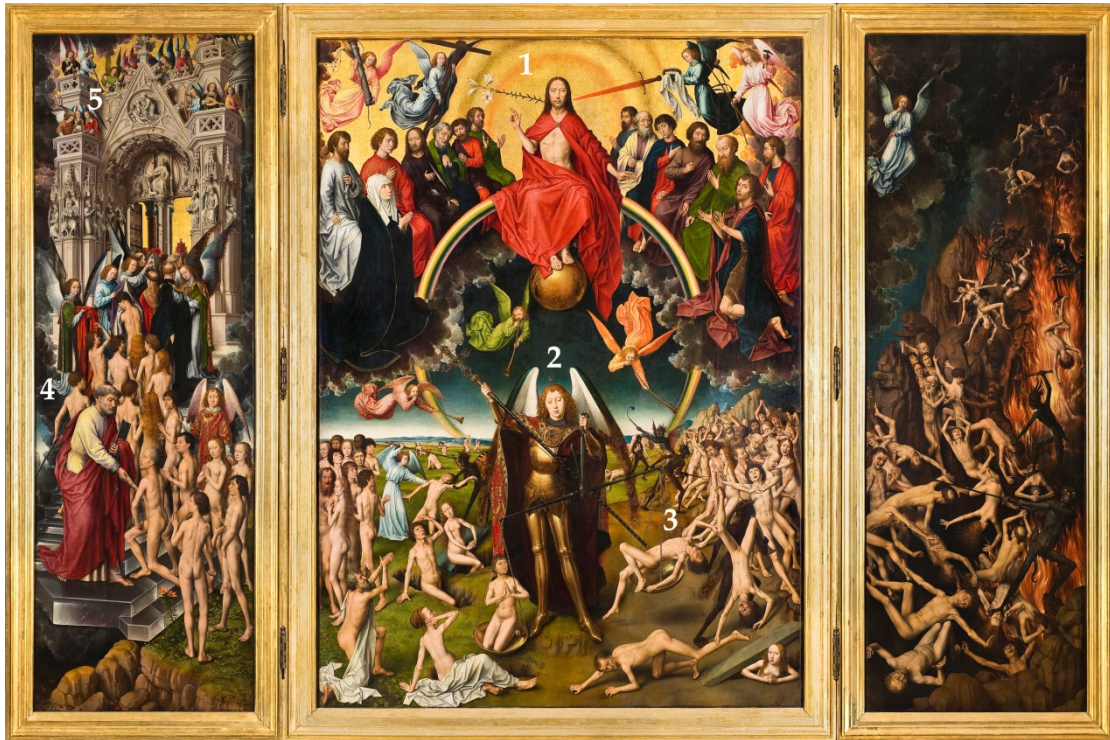
Figuur 15 – Het Laatste Oordeel, drieluik geschilderd door Hans Memling, 1466-1473 – Nationaal Museum, Danzig.