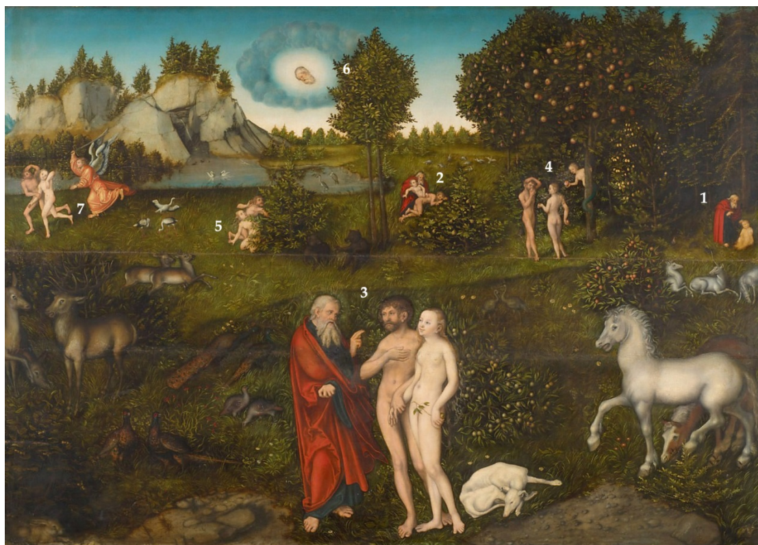
Figuur 2 – Het aardse paradijs, schilderij van Lucas Cranach de Oudere, 1530 – Kunsthistorisch Museum, Wenen .

God had hen verboden om te eten van de boom van kennis van goed en kwaad, die in het paradijs stond. Verleid door een slang doet Eva dat toch en zij laat ook Adam eten van de verboden vruchten. Daarop veranderde alles: de erfzonde kwam in de wereld en de mens werd een sterfelijk en zondig wezen. Door toedoen en door nalatigheid van de mensheid ontstond er veel ellende: oorlog, onderdrukking en terreur, armoede, verkrachting, haat zaaien en ander kwaad.