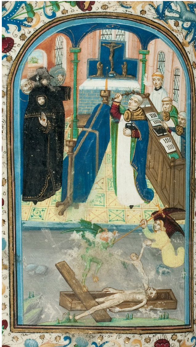
Figuur 18 – Miniatuur aan het begin van het dodenofficie, de gebeden voor de overledenen, in een gebeden- en getijdenboek uit circa 1480, oorspronkelijke verblijfplaats onbekend – Museum Catharijneconvent, Utrecht.

Het figuurtje van de duivel is beschadigd. Vermoedelijk is dat met opzet gebeurd. Er zijn meer miniaturen waarin duivels en voorstellingen van de hel zijn weggekrabd. 27