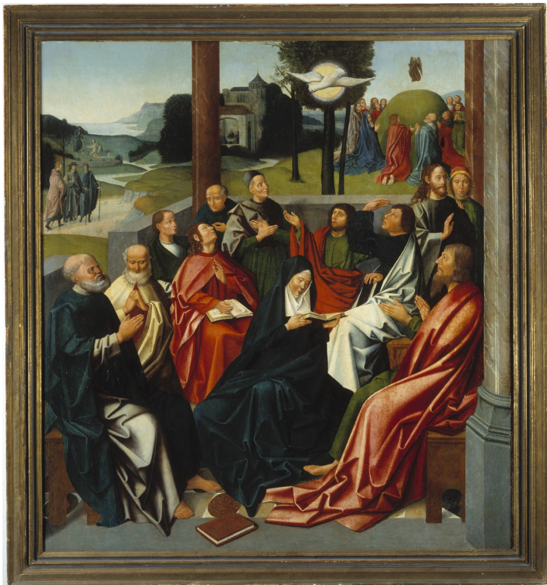
Figuur 5 – Neerdaling van de Heilige Geest. De apostelen en Maria zitten rustig bij elkaar als de Heilige Geest in de gebruikelijke gedaante van een duif boven hen verschijnt. In de achtergrond zijn verhalen uit de verschijning van Christus aan de apostelen na zijn dood afgebeeld, laatste kwart vijftiende eeuw – Museum Catharijneconvent, Utrecht.