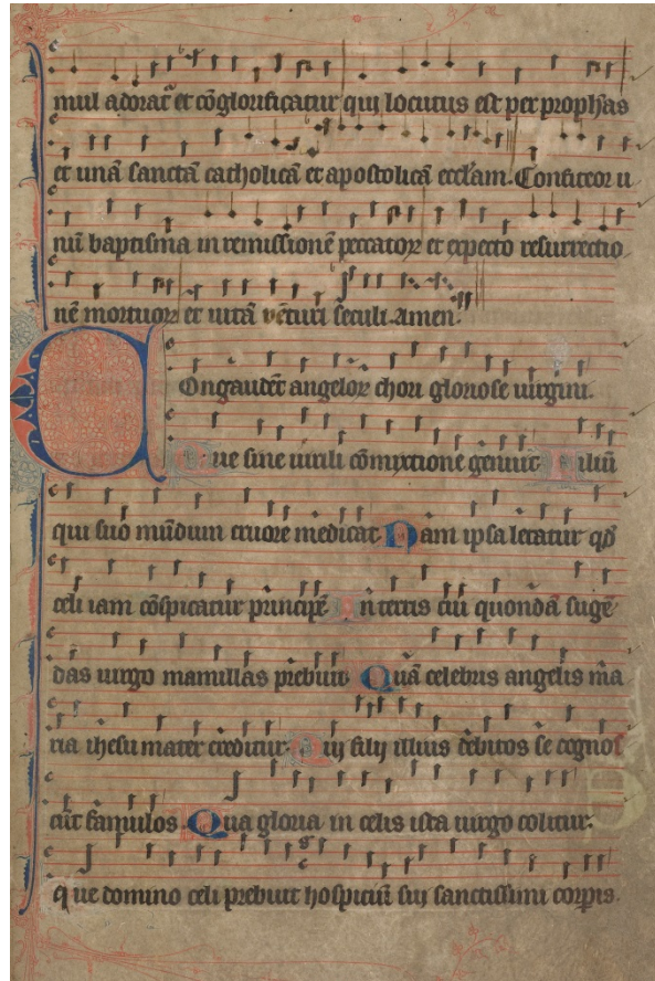
Figuur 14 – Bladzijde met het laatste deel van het Credo in een graduale , veertiende eeuw – Noord-Hollands Archief, Haarlem.

Van het Credo zijn in verband met de hoop op het hemels paradijs, de laatste twee zinnen het meest belangrijk (zie de omlijning in de afbeelding): 'Confiteor unum baptismum, in remissionem peccatorum. Et expecto resurrectionem mortuorum. Et vitam venturi seculi.' Vrij vertaald staat er: 'Ik belijd het doopsel tot vergiffe-