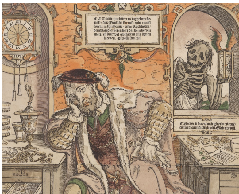
Figuur 1 – De rijke man en de Dood, uitsnede uit een prent van de Monogrammist AI, 1553 – Rijksprentenkabinet (Rijksmuseum) , Amsterdam.

Hoogmoed, jaloezie, boosheid, vraatzucht, wellust, luiheid en hebzucht worden vanouds beschouwd als de zeven belangrijkste zonden. Hebzucht was en is misschien wel de ergste, vanwege alle ellende die er uit voortkomt. Deze hoofdzonde is vaak afgebeeld, zoals in een prent uit 1553 (figuur 1). 6