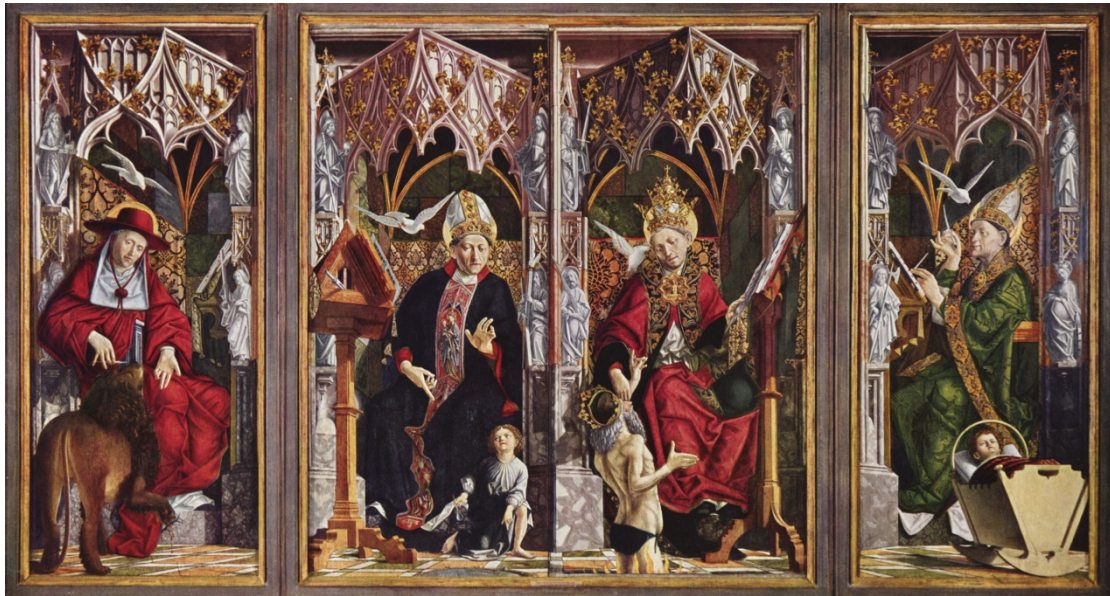
Figuur 9 – Schilderij met de vier kerkvaders, Michael Pacher, circa 1483-1484 – Oude Pinacothek, München.