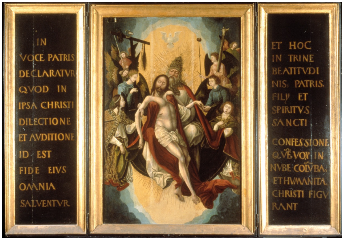
Figuur 3 – Schilderij met de Drie-eenheid, gebaseerd op een houtsnede van Albrecht Dürer uit 1511 – Museum Catharijneconvent, Utrecht. God de Vader houdt zijn Zoon op zijn schoot, terwijl de Heilige Geest zich in de gedaante van een duif boven hen bevindt. Op het lichaam van Jezus Christus zijn de wonden zichtbaar van zijn Kruisiging, met de gaten van de spijkers die door zijn handen en voeten werden geslagen en in zijn zijde de wond van de lans waarmee hij doorstoken werd. Rondom de Drie-eenheid bevinden zich engelen. Sommigen houden de martelwerktuigen vast, waaronder rechts de geselpaal en links een geselstok en het kruis waaraan Christus zou sterven.

In de luiken staat de volgende tekst: '(op het linkerluik) In de stem van de Vader wordt verklaard dat in de liefde zelf van Christus en in het luisteren naar hem, dat wil zeggen het geloof in hem, alles gered wordt (op het rechterluik) en wel in de belijdenis van de Heilige Drie-eenheid: Vader, Zoon en Heilige Geest, die verbeeld wordt door de stem in de wolk, de duif, en het menszijn van Christus. 8