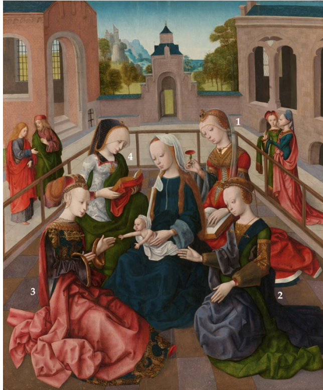
Figuur 7 – Maria, het Jezuskind en vier martelaressen, Meester van de Virgo inter Virgines, circa 1495-1500 – Rijksmuseum, Amsterdam . Totaalopname en detailfoto van het halssieraad van Catharina.

Een aantal heiligen heeft werkelijk geleefd, anderen zijn 'legendarische figuren' of er zijn legendes gekoppeld aan heiligen die wel degelijk hebben geleefd. 14